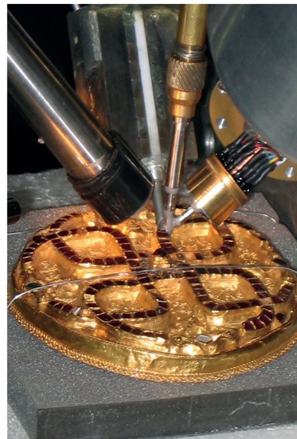
Die Scheibenfibel aus dem Fund von Wittislingen bei der Untersuchung in der Protonenbeschleunigeranlage AGLAE im Louvre.

E-Mail: akademisches-forum@bistum-augsburg.de www.bistum-augsburg.de/forum